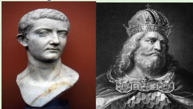
Deposto – Destronado

Imperador Odoacro Rômulo Augusto César Rei dos Hérulos